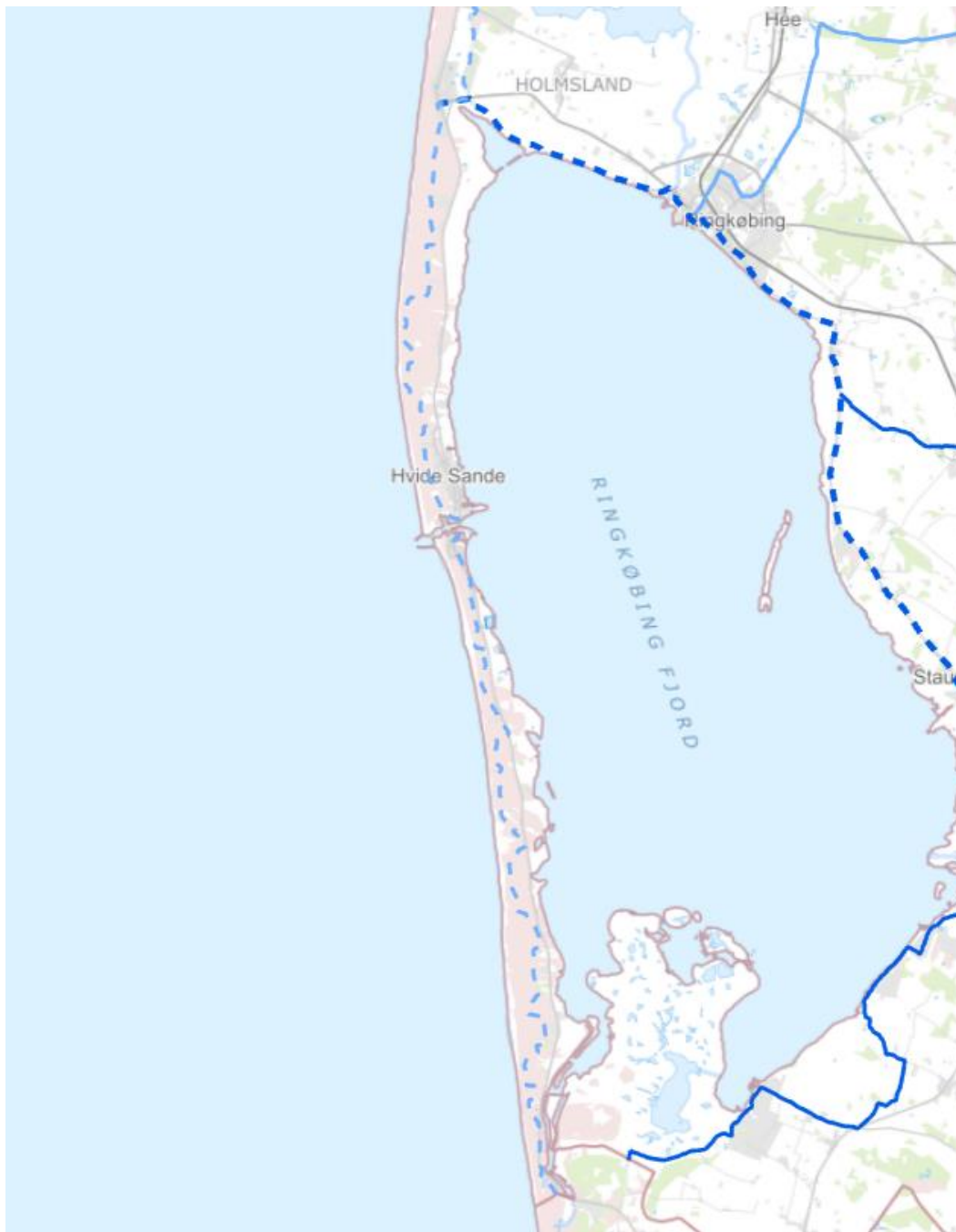
Figur 1: Vestkystrutens ca. 40 km lange forløb langs klitten

Da Holmsland Kommune i sin tid anlagde Vestkystruten mellem Søndervig og Nymindegab, blev den sikret ved lokalplan, og der blev indgået aftaler med lodsejerne vedr. anlæg og drift. Se figur 1 herunder for stiens forløb.